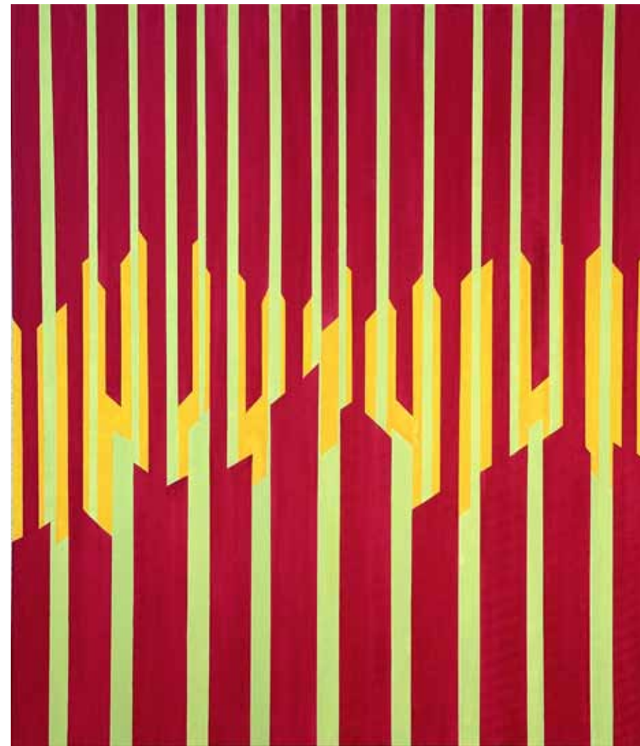
Forêt II ▲ Huile sur toile 70x60 cm 2023