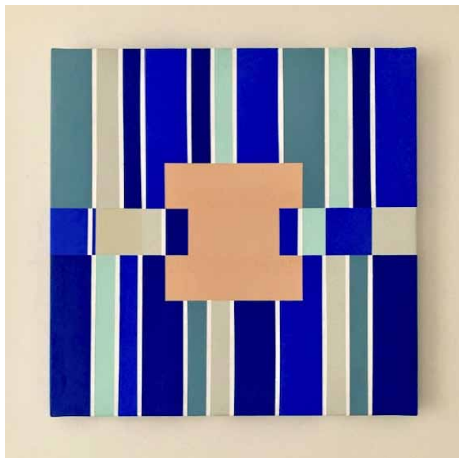
Carré sur partition I ▲ Acrylique sur toile 40x40 cm 2026