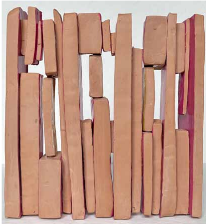
Forêt III ▲ Argile autodurcissante, laque acrylique, colle 19 x 18 x 3,5 cm 2026