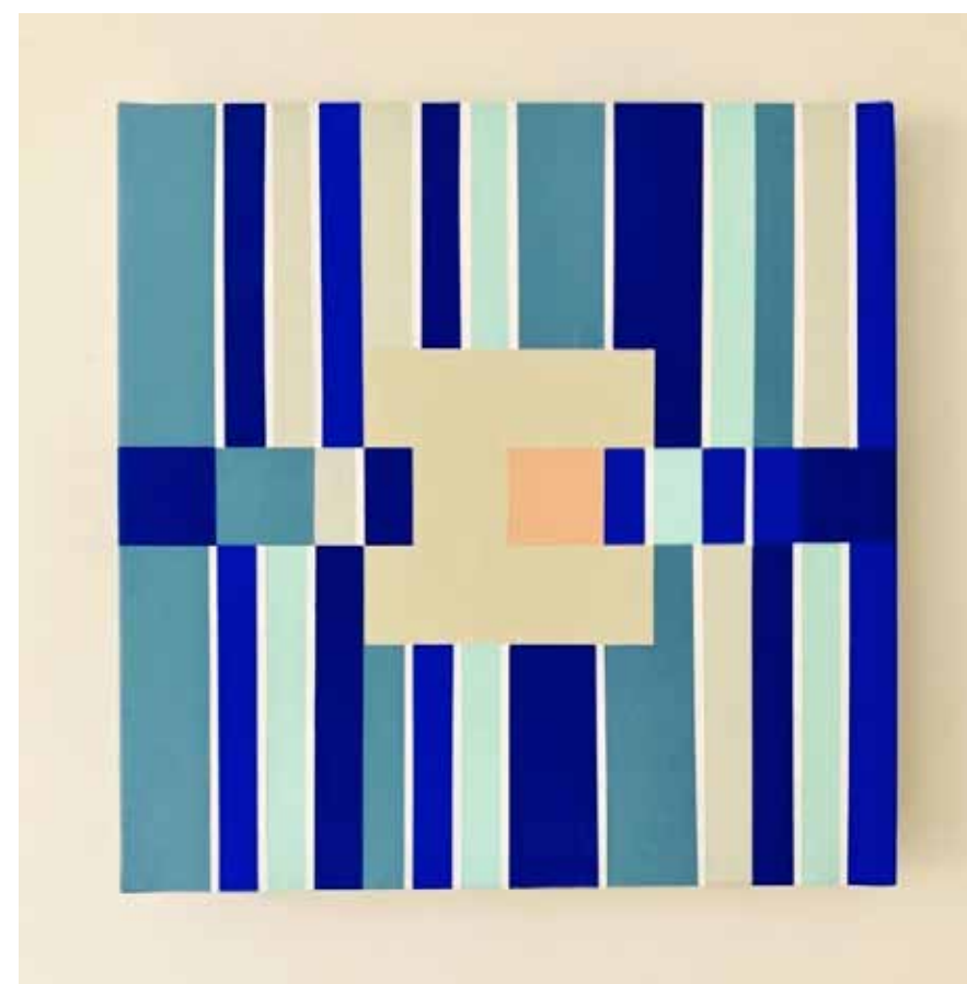
Carré sur partition II ▲ Acrylique sur toile 40x40 cm 2026