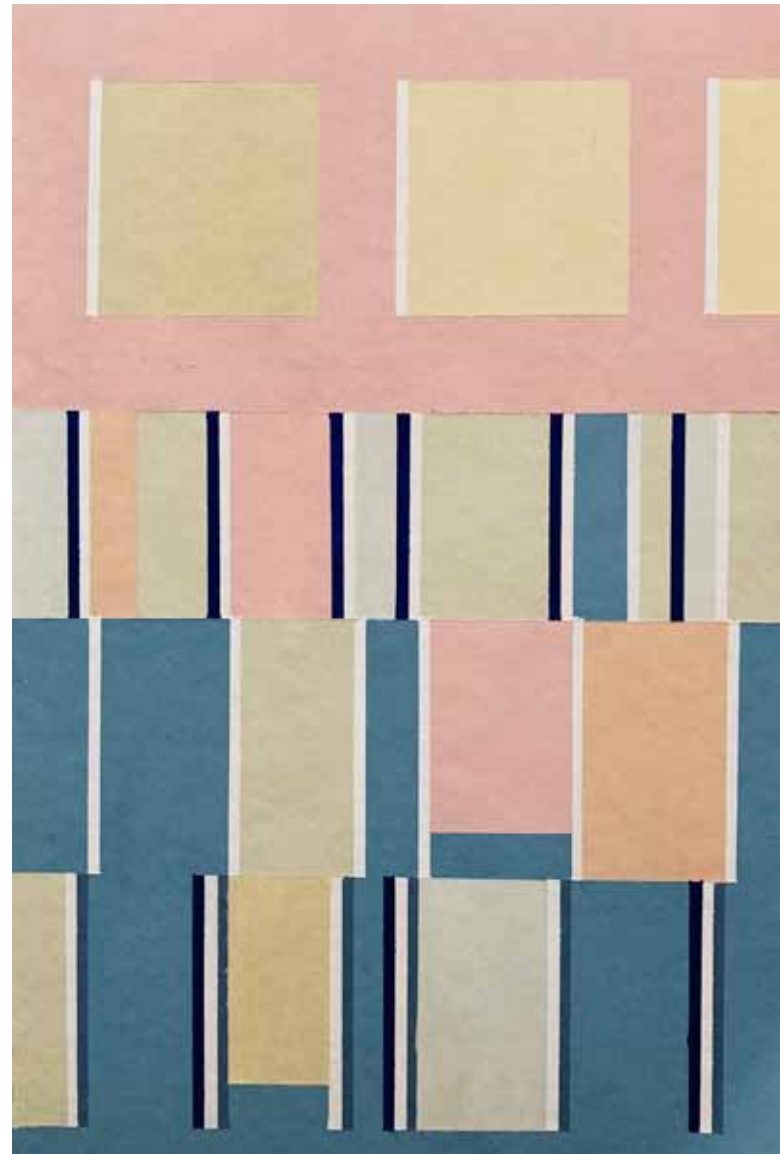
Résonances I ▲ Acrylique sur papier 300 g 51 x 35,5 cm 2026