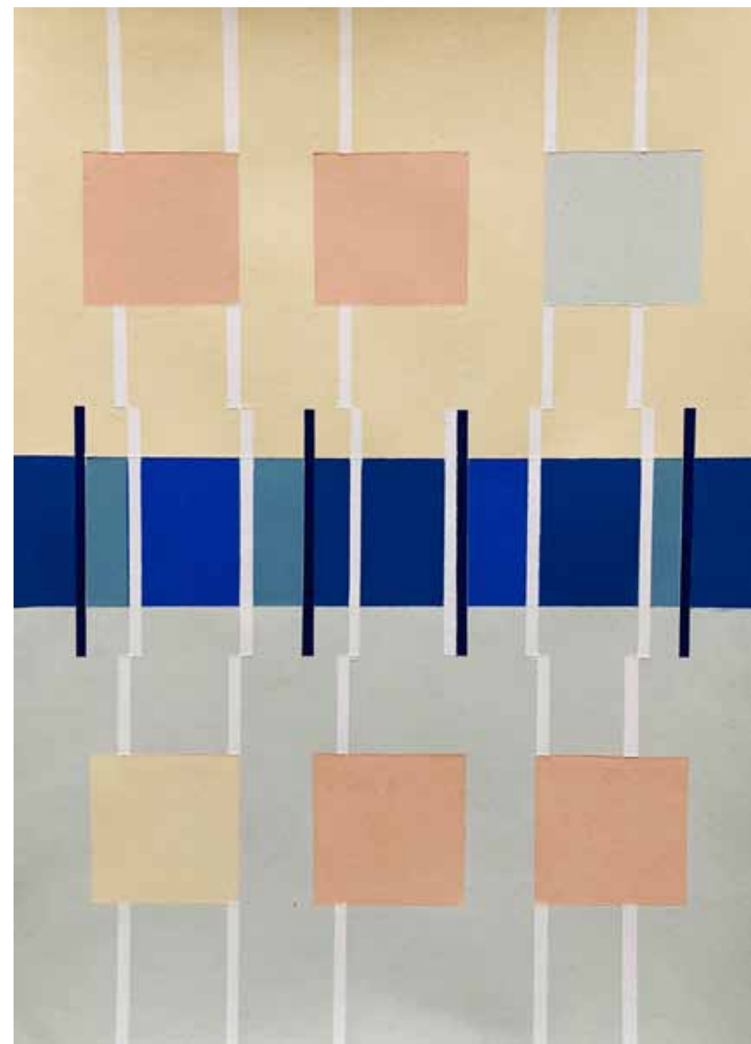
Résonances II ▲ Acrylique sur papier 250 g 42 x 29,7 cm 2026