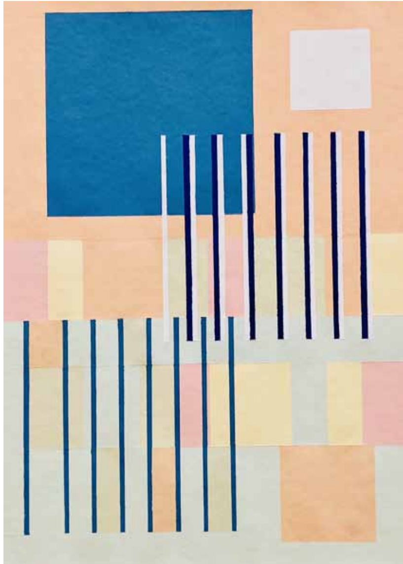
Résonances III ▲ Acrylique sur papier 300 g 51 x 35,5 cm 2026