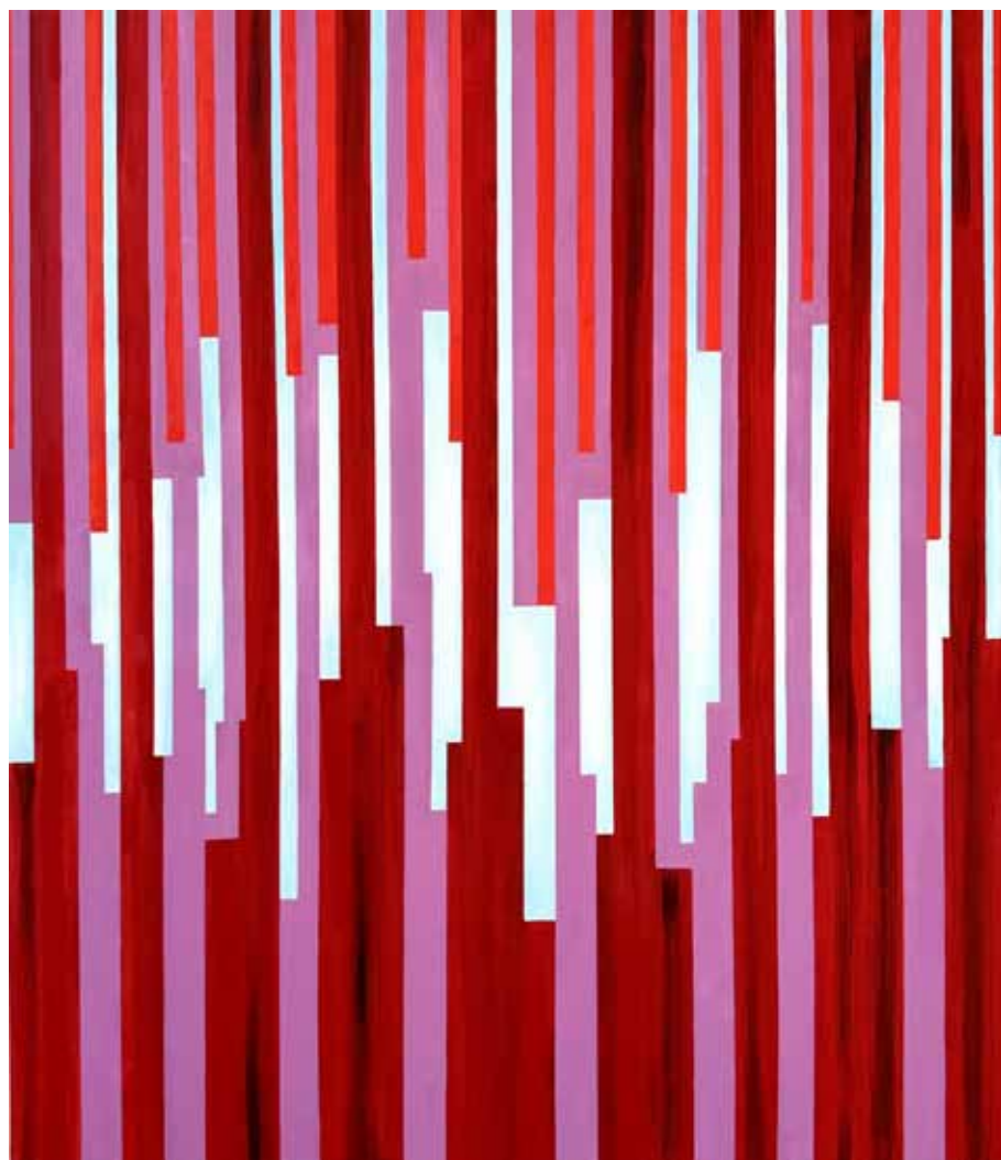
Forêt I ▲ Huile sur toile 70x60 cm 2024