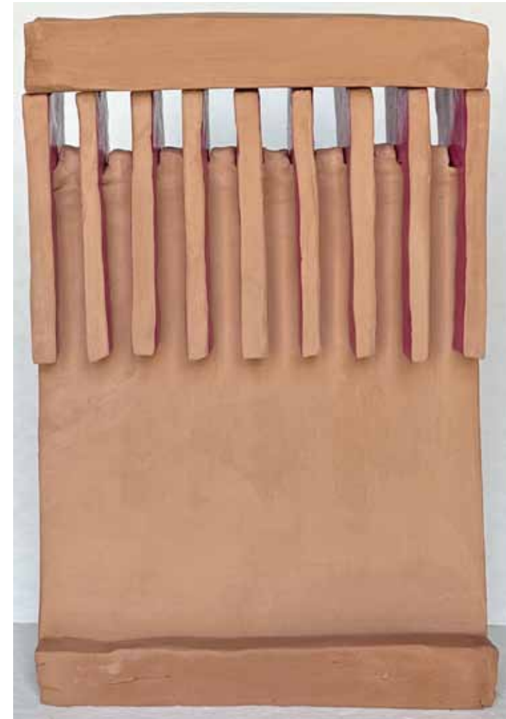
Transition ▲ Argile autodurcissante, laque acrylique, colle 27 x 18 x 5 cm 2026